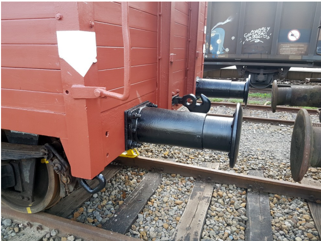
Restaurierte Puffer montiert am Verdener Ende von G 154.