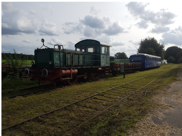
Diesellok 262 am komplett freigemähten Bahnhof Stemmen.

Verdener Eisenbahnfreunde Kleinbahn Verden-Walsrode e. V. ( www.kleinbahnexpress.de , auch auf Facebook und auf Instagram) Vereinsregister VR 180201 AG Walsrode Steuer-Nummer 48/210/03618 FA Verden