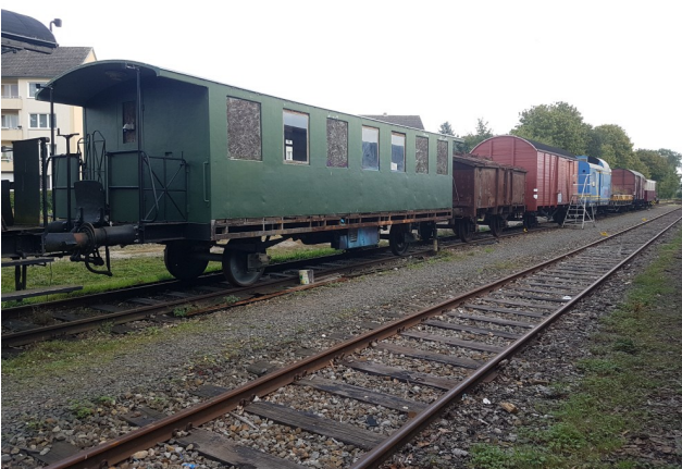
VEF-Fahrzeuge: Vorne Wg. 67 während der Blecharbeiten.